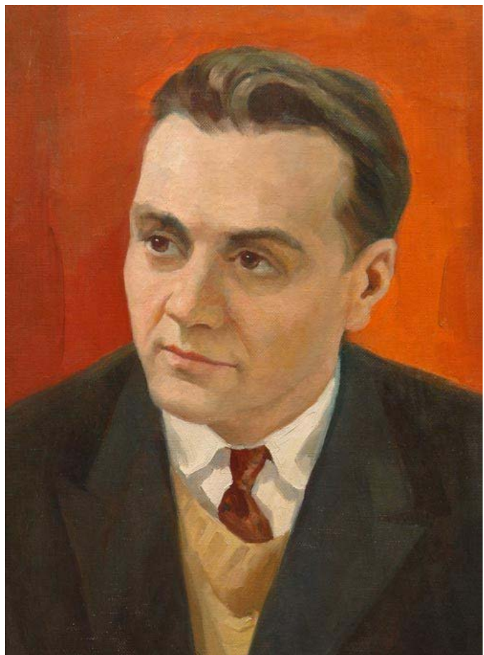
Василий Александрович Сухомлинский (1918-1970)

«Не будем бояться этих слов – святое и незыблемое».